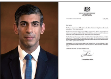
英国首相里希·苏纳克的办公室在世界法轮大法日来临之际,发信函表达对法轮功的支持。