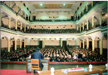
武汉第二期法轮功传授班(1993.3)

1992年5月13日李洪志老师在长春第五中学举办第一期法轮功学习班，参加学员约180人。1992年9月法轮功被确定为中国气功科研会的直属功派。