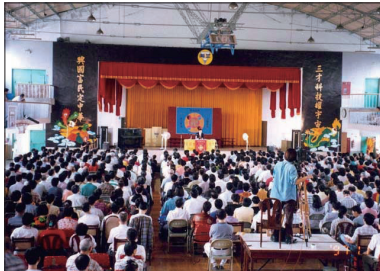
1997年11月16日，李洪志大师在台湾台北三兴国小讲法。

台湾已有数十万人学炼，近一千个炼功点遍及全台湾各县市。许多县市每年在寒暑假举办“法轮大法教师研习营”活动，各大专院校也成立大法社团。因教化人心效果显著，台湾各地监狱陆续将法轮功纳入教化课程中。法轮功在台湾普遍受到政府部门及各界的高度肯定！