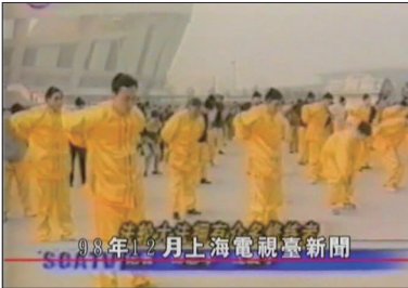
上海电视台:1998年11月24日报道 法轮功已传遍全球四大洲，称全世界已有一亿人在炼法轮功。