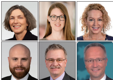
德国六位政要致函法轮功学员表达对法轮功创始人李洪志先生的敬意