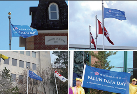
加拿大安省斯库格镇（左上）、安省剑桥市（右上）、萨省萨斯卡通市（左下）、安省布洛克市（右下）升旗庆祝法轮大法日。