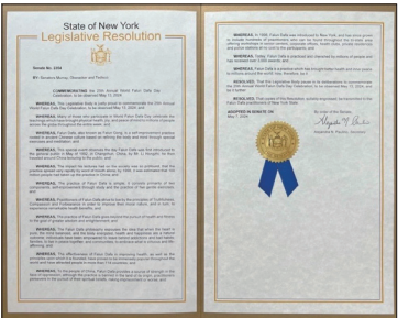
纽约州参议院通过第2354号决议案恭贺第25届世界法轮大法日