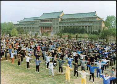
长春法轮功学员在地质宫广场炼功

从1992年法轮大法公开传出至1994年12月，李洪志先生应各地气功组织、气功科学研究会或政府单位的邀请，先后在全国共举办56期法轮功传授班，每期约十天，约六万人次参加。先后到过长春、北京、太原、山东冠县、武汉、广州、山东临清、贵阳、齐齐哈尔、重庆、合肥、天津、山东垦利、辽宁凌源、石家庄、大连、锦州、成都、郑州、济南、湖南郴州、哈尔滨、吉林延吉等23个城市亲自传授。由于法轮功在祛病健身、提升道德方面具有神奇功效，很多人身心受益从疑难绝症中康复，口耳相传，使法轮功在全国迅速普及。