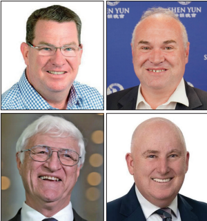
澳洲多位议员亲临5.13庆祝活动现场或致信表示祝贺。

宾州24位政要发来褒奖贺信。参议院外交关系委员会主席、马里兰州联邦参议员本·卡丁为“法轮大法日”颁发特别褒奖令，“向李洪志大师和『真善忍』原则表示敬意”。