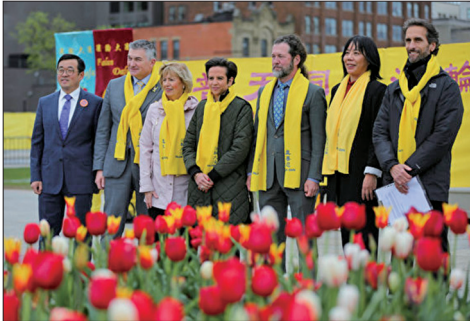
加拿大部分国会议员与法轮功学员在法轮大法洪传32周年庆典上合影。