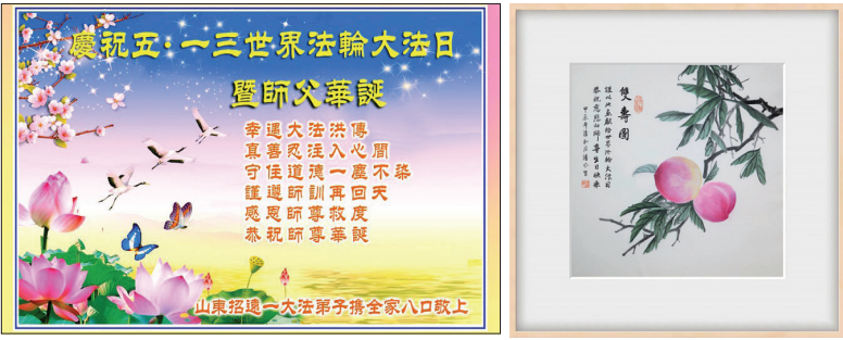
中国法轮功学员恭祝师尊华诞的贺卡及绘图。

内蒙古扎兰屯市一青年教师大法弟子写道：“弟子从一个好学生到一个好教师。真的能感受到是您一直在造就着我。弟子一定多学法，不辜负师尊的慈悲苦度。”河北张北县的一名小弟子说：“出生在有大法弟子的家庭很幸运，不会迷失在常人的大染缸里。”吉林省长春一大法弟子恭祝慈悲伟大师父生日快乐：“二十多年来，在师尊的保护和法轮大法法理的指导下，使我从一个非常自私、在各种利益面前与人争斗的常人变成了一个心地善良，做事能站在对方或者别人的处境中去考虑。这都是在师尊的救度和保护下，在大法法理的指导下，才能走到今天，成为大法弟子！为此向师父道一声“师尊：您辛苦了”！