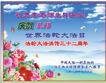
中国民众祝贺李洪志大师贺卡