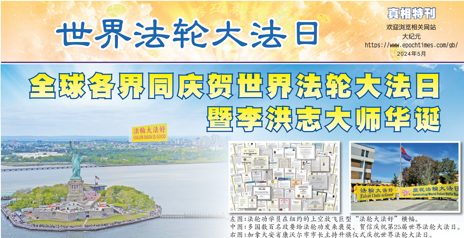
左图:法轮功学员在纽约的上空放飞巨型“法轮大法好”横幅。 中图:多国数百名政要给法轮功发来褒奖、贺信庆祝第25届世界法轮大法日。 右图:加拿大安省康沃尔市市长主持升旗仪式庆祝世界法轮大法日。

2024年5月13日是第二十五届世界法轮大法日暨法轮大法传世三十二周年。这天也是法轮大法创始人李洪志师父七十三岁华诞。