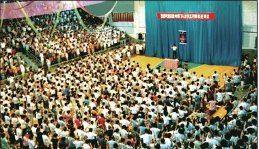
大连第二期法轮功传授班(1994.7)