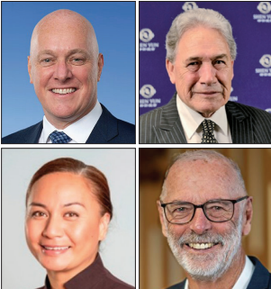
新西兰总理(左上)、副总理(右上)等多个政要办公室发电邮表达祝贺。