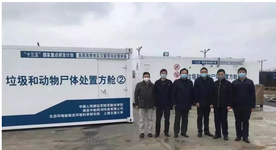
2020年，40台移动火化炉驰援武汉，每台日烧5吨。

他说，他朋友的姐姐披露，2020年初的第一波新冠疫情中，武汉死了几十万人，至少在十万人以上。有五个武汉的火葬场24小时全开，把好几个炉子都烧炸