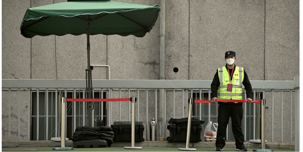
示意图。2022年10月14日，一名保安在北京海淀区四通桥旁的路口站岗。

香港《明报》4日报导，两会未开始，北京海淀区的大爷大妈就已上岗，3月1至15日，每个社区都要派志愿者守路口、桥梁。西四环一座桥边，3日，插有“群防群治岗”红旗，有志愿者着大衣、戴帽子站岗。