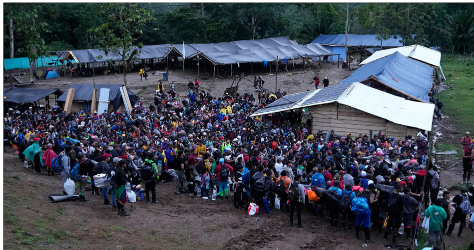
哥伦比亚和巴拿马边境交界的达连隘口的偷渡者队伍中赫然出现中国人的脸孔。

从中南美洲千里跋涉不顾危险穿越热带森林前往美墨边境的中国非法移民越来越多，俗称“走线”。今年1月至9月，美国边境巡逻队逮捕了22,187名从墨西哥非法越境的中国人，这数字几乎是2022年同期的13倍。其中人数最高峰出现在9月，计4010人，比8月多了70%。