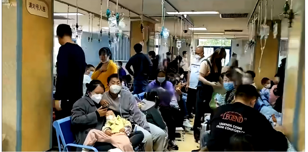
这是网友拍摄的10月31日北京儿童医院状况，医院已经收不下支原体感染的儿童住院了。

11月2日，北京市疾控中心发布消息，北京市儿童医院每日呼吸道感染接诊病例已经达到3500人至3600人。有患儿家长表示，医院到处都是排着长队的人群，输液室根本挤不进去，医院每层楼道都被输液患儿挤得满满当当，候诊时间长达七八个小时。