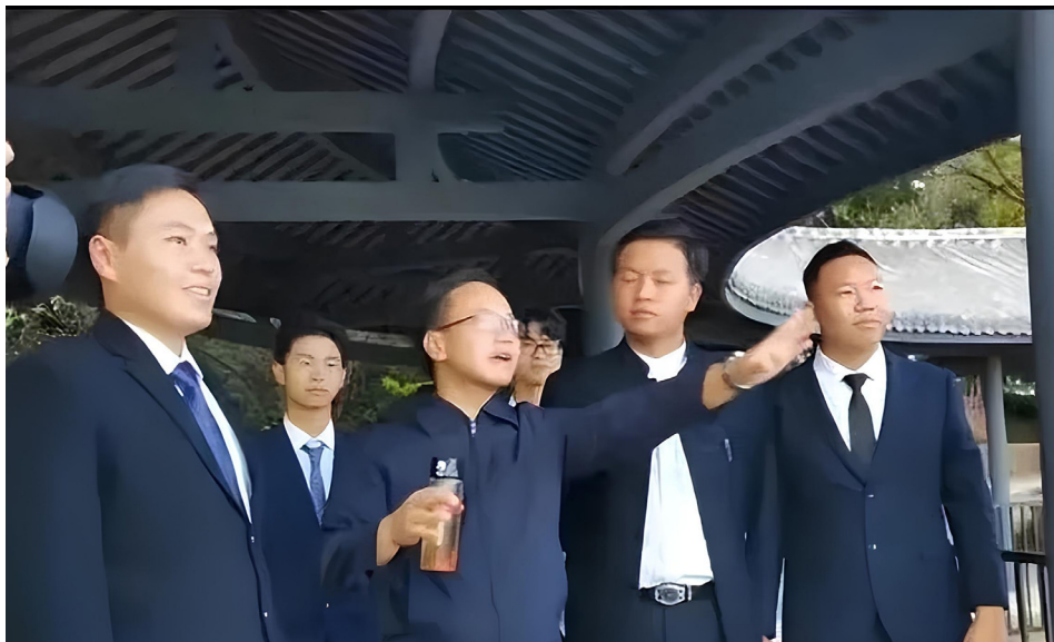
云南国土资源职业技术学院的学生模仿领导“视察”学校工作。

最重要的是，这位“领导”视察时，一旁的人都表现出诚惶诚恐、毕恭毕敬、唯唯诺诺的样子。“领导”一行人一进校门，保安就向他们敬礼，上前为“领导们”开道。“领导”询问食堂阿姨们时，阿姨个个恭恭敬敬地站着听训。“领导”视察校展览馆时，