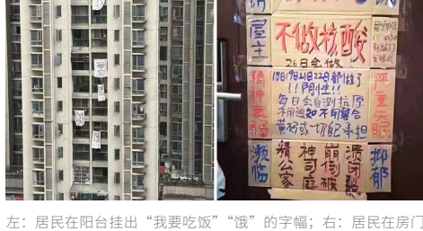
左：居民在阳台挂出“我要吃饭”“饿”的字幅；右：居民在房门上贴着“不做核酸”“精神崩溃”。

2022年春季以来，国际社会普遍抛弃了各类极端防疫措施，采取开放的态度，选择与新冠病毒共存。而中共却掀起了一轮接一轮的“封城”，从长春、东莞、深圳，到上海，伊犁，成都，大庆，贵阳……越来越多的城市搞起了“清零”（或曰“静态管理”）的极端措施。