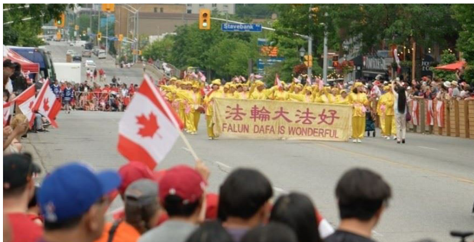
7月1日，多伦多法轮功学员组成的天国乐团、腰鼓队参加了在密西沙加市的国庆游行。

当天国乐团和腰鼓队经过时，路旁的很多观众都为其欢呼，并伴随着音乐的节奏拍手，为他们的方阵拍照、录像，观众们感谢法轮功给人们带来的美好。