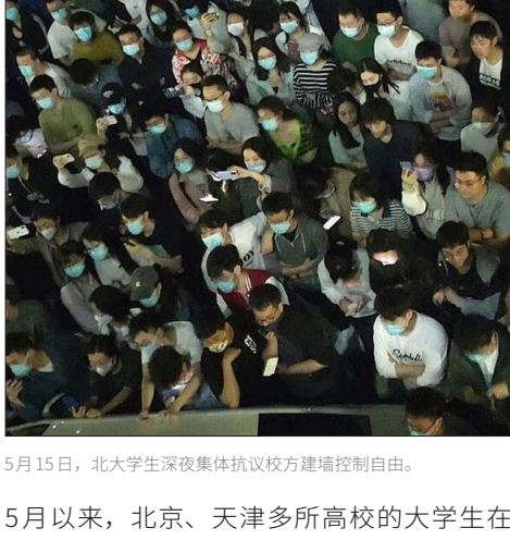
5月15日，北大学生深夜集体抗议校方建墙控制自由。