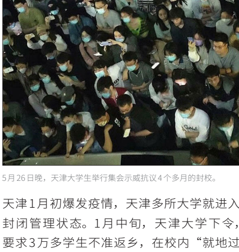
5月26日晚，天津大学生举行集会示威抗议4个多月的封校。

5月26日晚，网上传出天津大学学生抗议的视频。视频中，大批学生在校内广场聚集，抗议封校，并高喊“打倒官僚主义”“打倒形式主义”等口号。还有消息称，大批警察正赶往抗议现场。