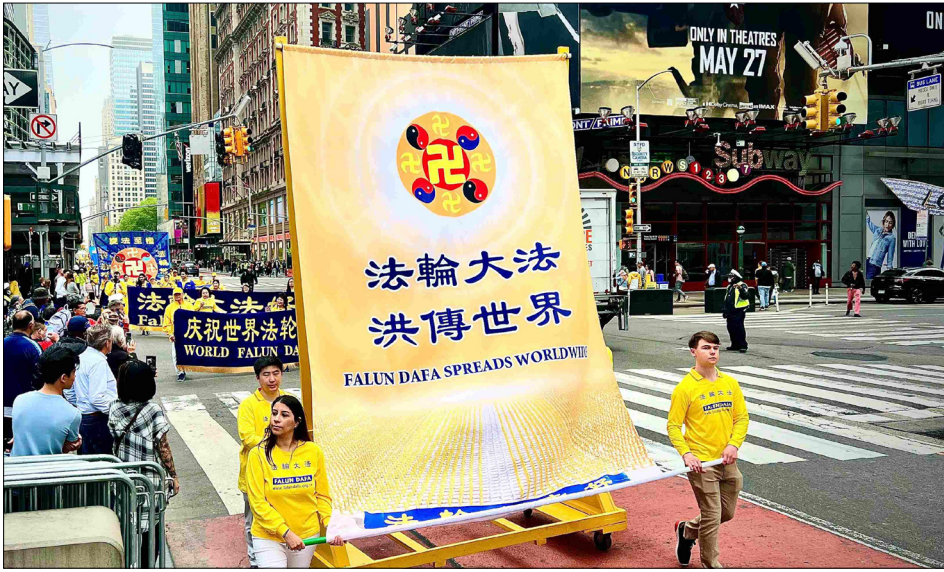
2022年5月13日，4000名法轮功学员在纽约曼哈顿举行盛大游行庆祝“世界法轮大法日”。

我今年54岁，1998年开始修炼法轮大法。感恩师尊传出这么好的大法，才有今天的我与和和美美的家。