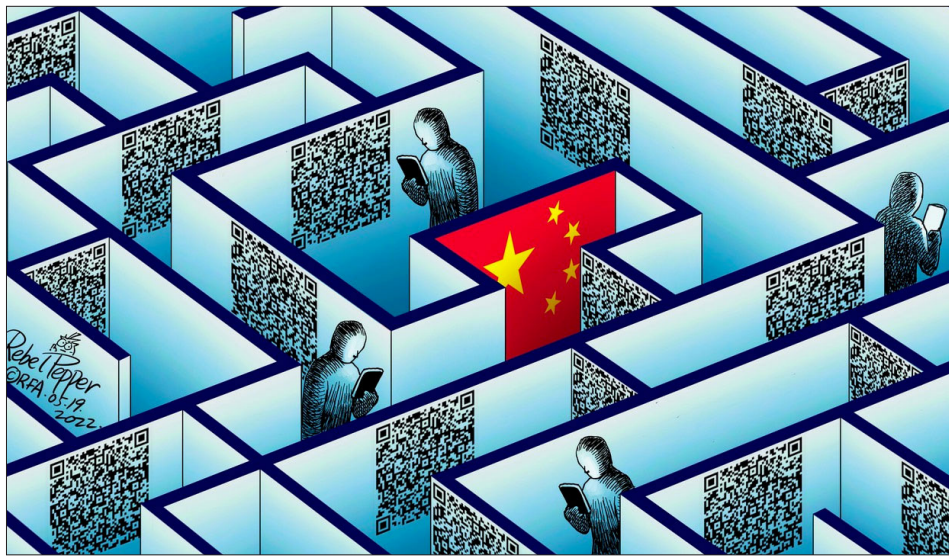
漫画：变态辣椒。中国被认为是首个使用手机应用程序“健康码”控制疫情的国家。“健康码”在大数据背景下运作，除了搜集疫情数据，也能掌握民众身在何处、个人消费、银行存款等私人信息。

理、双碳目标、房地产”等政策，只不过他将责任推给了执行层面。他认为，有的是中长期的政策，不能把它短期化，也不能把它地方化，这就造成“合成谬误”，让大家对未来的发展没有信心。